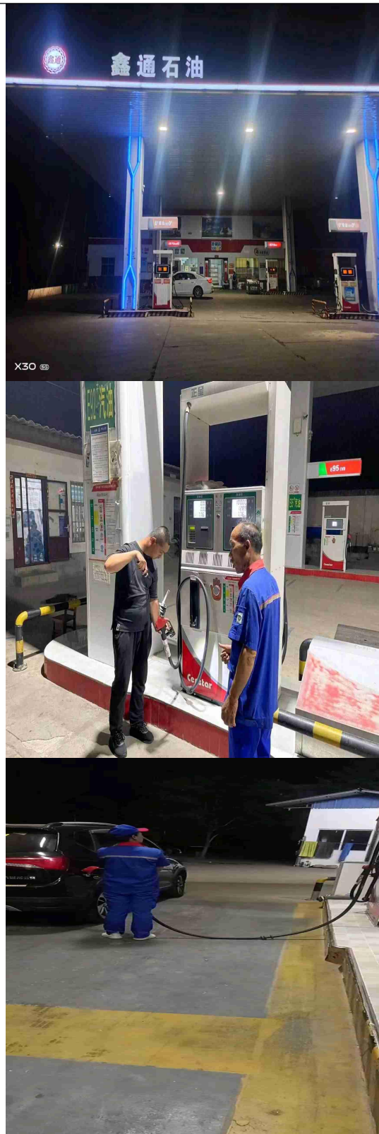
图 片 资 料